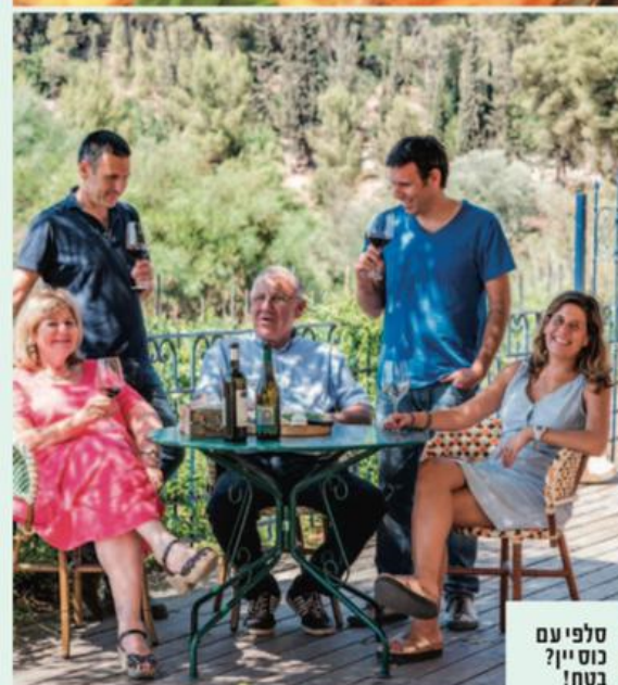
סלפי עם כוס יין? בטח!