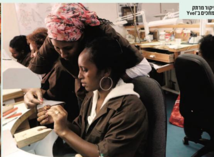
ביקור מרתק ומחכים ב"Yvel"