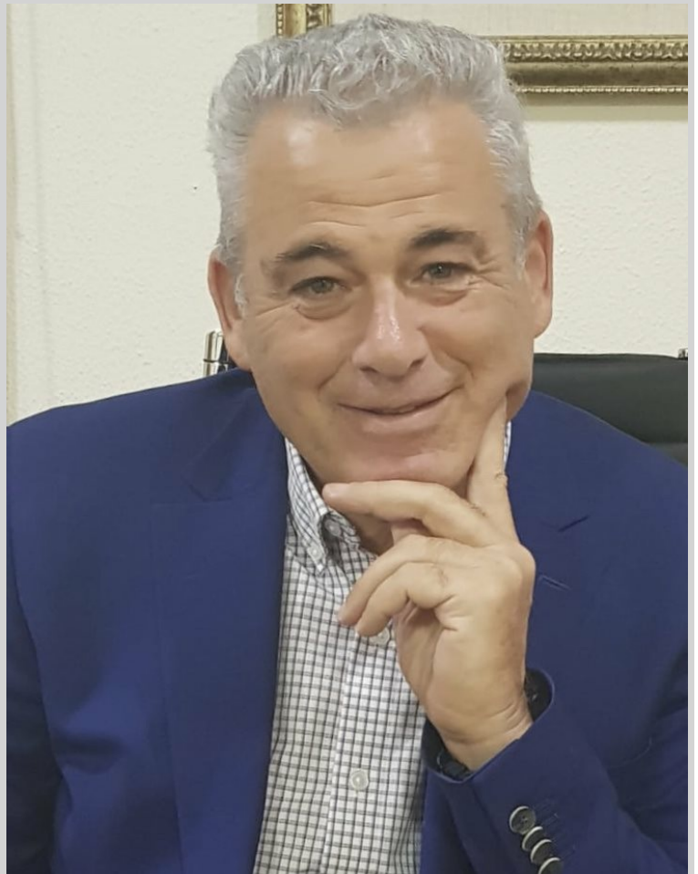
דודו עז צילום יחצ

לצד הפעילות השוטפת, בימים אלה נרקם שיתוף פעולה בין הרשת לבין מיזם "אקולוגיה לקהילה מוגנת", השוכן באזור הצפון. "אקולוגיה לקהילה מוגנת", הינו מיזם חברתי ייחודי הפועל בשני ערוצים: פירוק פסולת אלקטרונית לצורכי מכירה או מחזור. המיזם מספק תעסוקה לכ- 100 עובדים בעלי צרכים מיוחדים ומאפשר להם להשתלב באוכלוסייה. שיתוף הפעולה בין הרשת למיזם כולל, בין היתר, איסוף פסולת אלקטרונית מהמלונות.